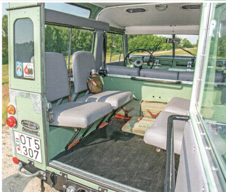
Hosszanti padok helyett négy felhajtható üléssel szerelték a Station Wagon-t. Sokkal rövidebb, mint egy mai kisautó, mégis hétszemélyes