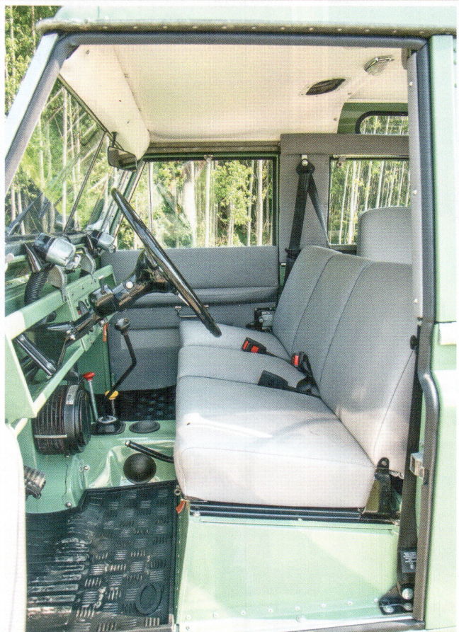
Magasra kell ülni, az első pad háromrészes, az ideális vezetői pozíció erősen alkatfüggő